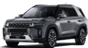
Platinum Gray (ADA)*