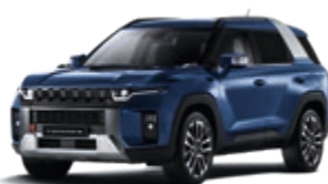
Dandy Blue (BAS)*