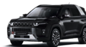
Space Black (LAK)*

Kraftstoffverbrauch kombiniert (WLTP, l/100 km): 9.1 – 7,9; CO 2 -Emission kombiniert (g/km): 207 – 181; (VO EG 715/2007).