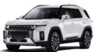
Grand White (WAA)