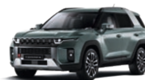
Forest Green (GAO)*