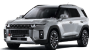
Iron Metal (ADE)*