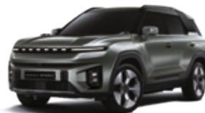
Forest Green (GAO)*