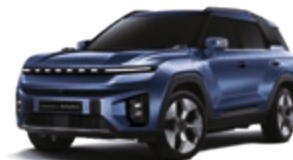
Dandy Blue (BAS)*