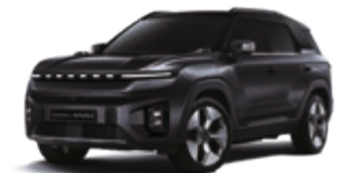
Space Black (LAK)*