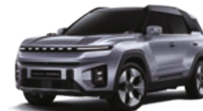
Iron Metal (ADE)*