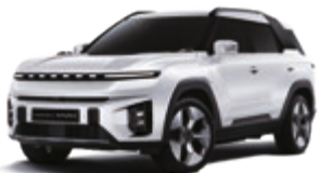
Grand White (WAA)