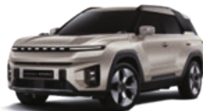
Latte Greige (EBL)*